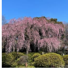
櫻木神社の枝垂れ桜