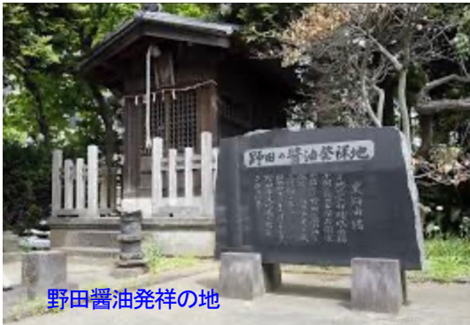
野田醤油発祥の地